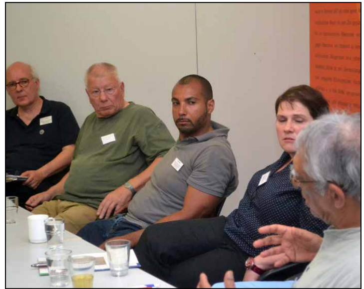
Auf einer Brücken-Bauen-Veranstaltung in Göttingen