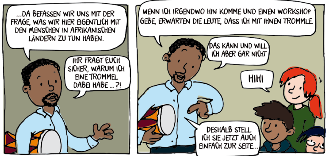
Aus der VEN-Handreichung „Voll konkret! Methoden zum Globalen Lernen“

Doch Globales Lernen, wie wir es verstehen, kann und sollte zur Offenlegung und kritischen Hinterfragung vorhandener Bilder, Muster, Stereotypen und Rassismen beitragen. Aktives „VerLernen“ im Sinne einer rassismussensiblen und postkolonialen Bildungsarbeit bietet eine wichtige Grundlage für gesellschaftliche Veränderungen. Als Bildungsreferent_in entscheide ich, welche Themen